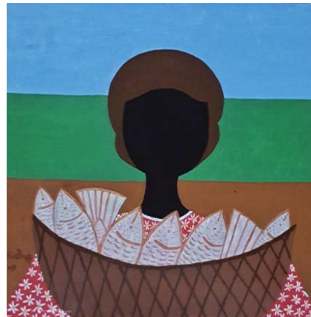
Peixes (2017) de Julio Paraty

O peixe assado em telha canal, as sardinhas assadas na brasa, o cozido de carnes, os pratos com feijão e as doçarias foram os legados mais importante da influência portuguesa. Graças ao conhecimento adquirido durante a ocupação árabe na península ibérica, o manuseio do açúcar pelos portugueses proporcionou o aumento da produção deste produto e do melão nos engenhos de Paraty, fomentando, assim, um receituário com doces originais seculares presentes até hoje no calendário das festas religiosas do município.